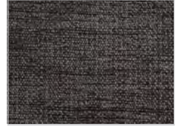
tessuto maple: 192