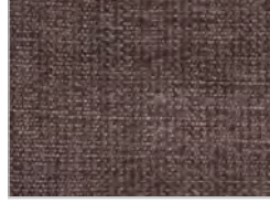
tessuto maple: 362