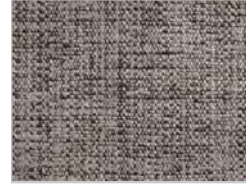
tessuto maple: 162