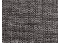
tessuto maple: 142