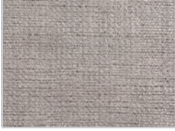
tessuto maple: 222