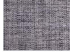
tessuto maple: 742