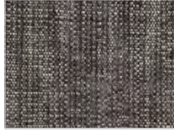
tessuto maple: 132