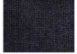
tessuto maple: 792