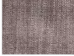
tessuto maple: 232