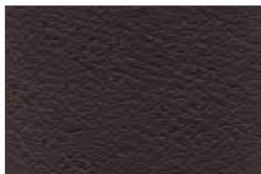
085 TESTA DI MORO DARK BROWN