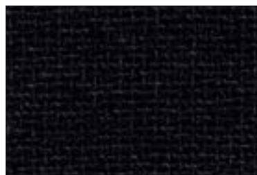
057 GRIGIO ANTRACITE ANTHRACITE GREY

051 Cat.ZC pelle Churchill Cat.ZC leather Churchill