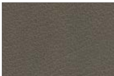
045 GRIGIO CHIARO LIGHT GREY