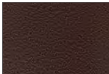
081 MARRONE BROWN