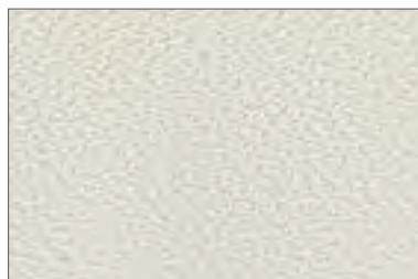
003 POLVERE DUSTY